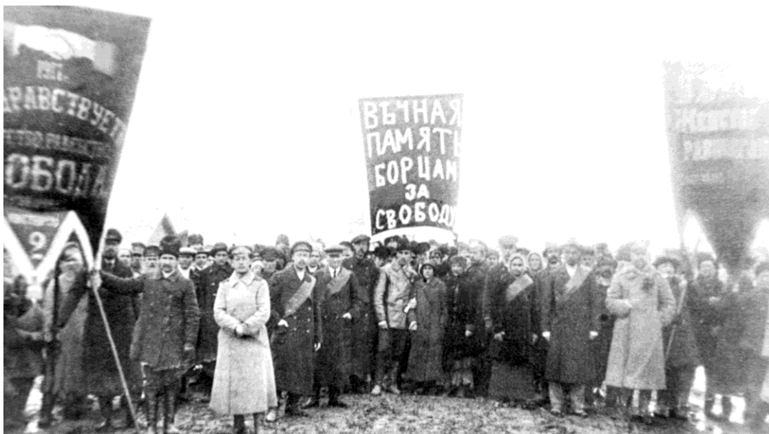
Демонстрация в г. Самаре в дни Февральской революции 1917 г.